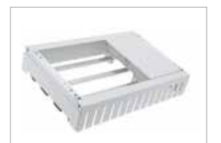
Kapama parçaları ve profilleri